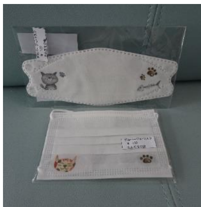
デコパージュマスク