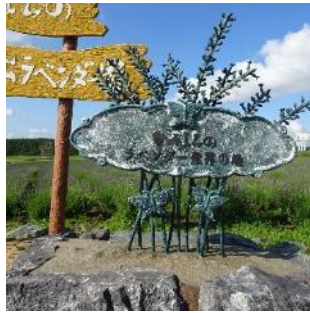
ラベンダー発祥地

北海道に来た目的は、母の故郷斜里で親戚と会う事です。手がかりは叔父からの住所の手紙だけです。地元の方に聞きながら初めて叔父家族に会えました。本当に嬉しかったです。