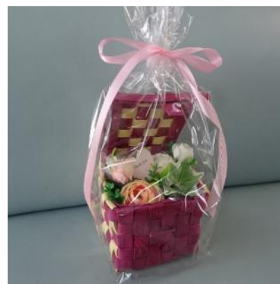
ボックスアレンジメント